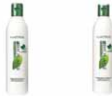
temizleme Ferahlatıcı Şampuan