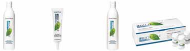
temizleme Kepek önleyici Şampuan