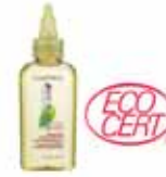
bakım yağı Delicate Care